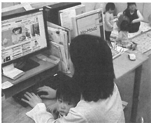
図2 本社でのデスクワーク

り場なのでそのルールに準じて働く必要があり、子連れで就業できる時期やスタッフ数は限られ、ハードルはかなり高い。夫の転勤で地方に転居したスタッフや、集中力を要するデザインを担当するスタッフの中には、在宅勤務のケースもある。これらは予定していたわけではなく、ハプニング的に生じた事例に対応する形でつくってきた働き方である。余裕が出てくると、別の仕事を任されることもある。柔軟さがワークシェアリングの可能性を広げている。