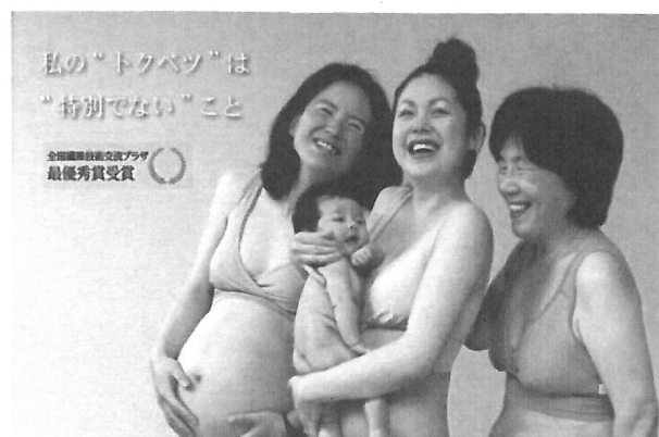
図6 ユニバーサルデザインのブラを被災地に送るキャンペーンポスター