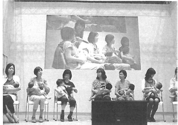
図1 授乳しながらのファッションショー

買うのは我慢する。子どもが成長するまで外に出なければよいのだから。」という声が聞こえてきた。そこで、ステージ上で授乳するファッションショー（図1）を開催することにした。